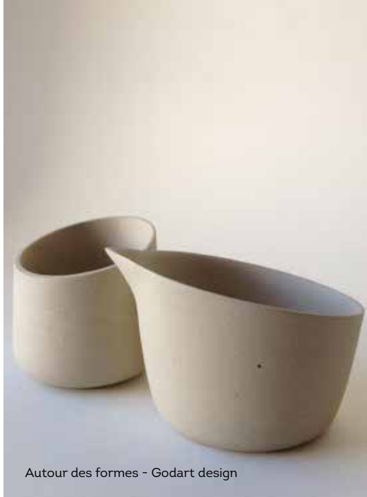
Autour des formes - Godart design